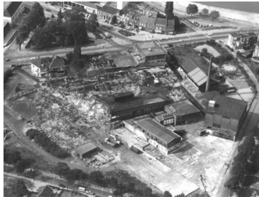
Luchtfoto papierfabriek Tielens 14 juni 1976 brand voordat het gebouw gesloopt kon worden

Aan de overkant van de straat ligt het driehoekige Krayenhoffpark. U slaat aan het einde rechtsaf